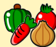
野菜類でビタミン、ミネラルを摂取